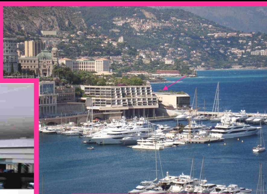
AUDITORIUM RANIER III