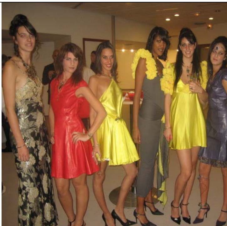
Alcune immagini dell'evento